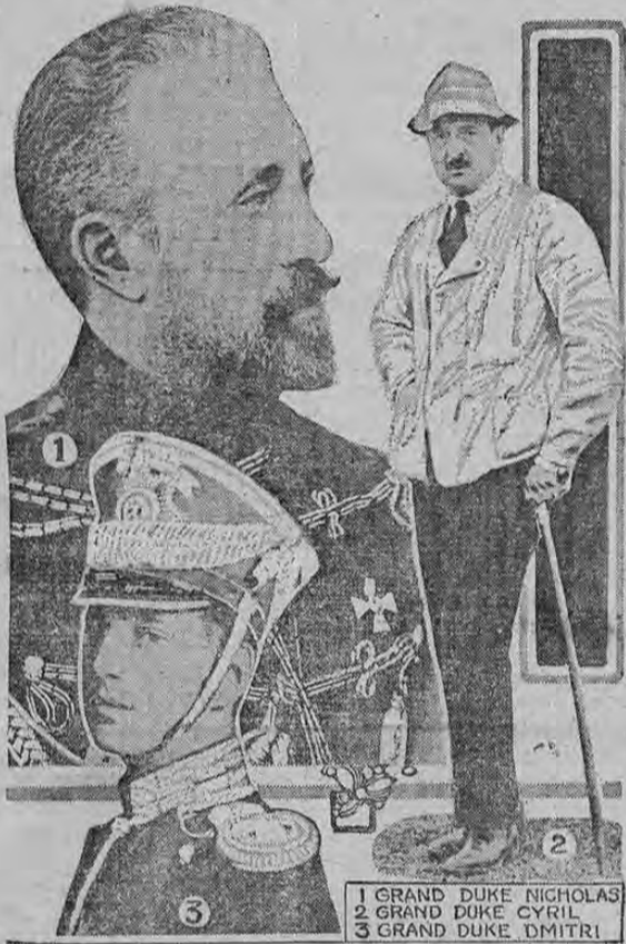
1 GRAND DUKE NICHOLAS 2 GRAND DUKE CYRIL 3 GRAND DUKE DMITRI

Indudablemente la invasión rusa a Alemania ha constituido una nueva faz de la guerra europea. Millares de rusos han cruzado la frontera alemana, y se encuentran a más de 50 millas adentro de los dominios del Kaiser. El Gran Duque Nicolás Nicholavitch, sobrino del Czar es el Comandante en Jefe de la Armada y está al frente del ejército que marcha a la cabeza del avance. El Gran Duque Cirilo y el Gran Duque Dmitri, también parientes cercanos del Czar, están incorporados en las primeras avanzadas del ejército.