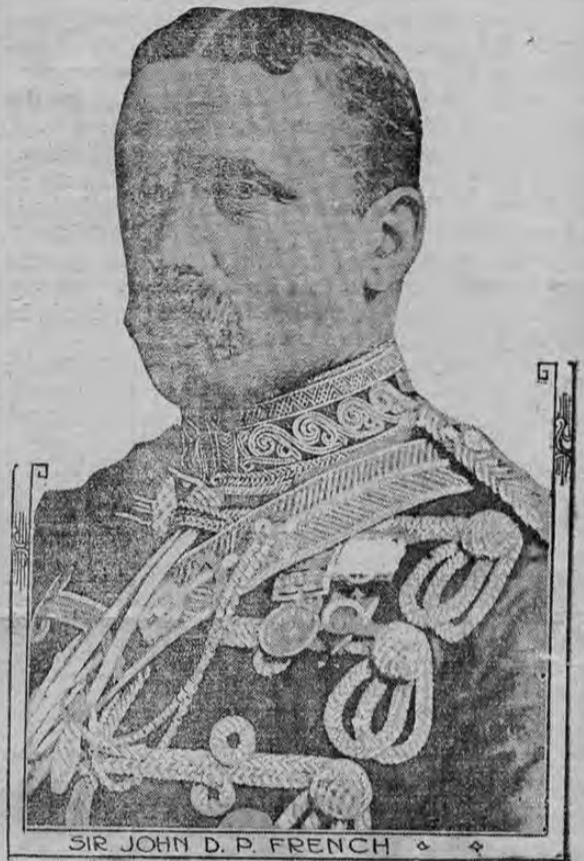
SIR JOHN D. P. FRENCH

GENERAL SIR JOHN DENTON PINKSTONE FRENCH